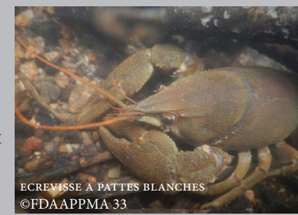
ÉCREVISSE À PATTES BLANCHES

Groupe de travail Listes Rouges Poissons & Ecrevisses