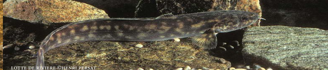
LOTTE DE RIVIERE