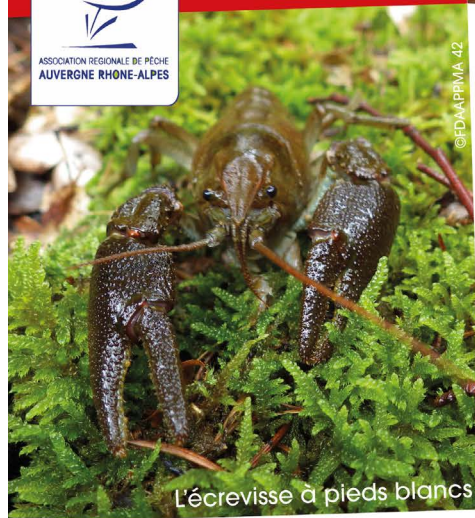
L'écrevisse à pieds blancs

PRÉFET DE LA RÉGION AUVERGNE- RHÔNE-ALPES Liberté Égalité