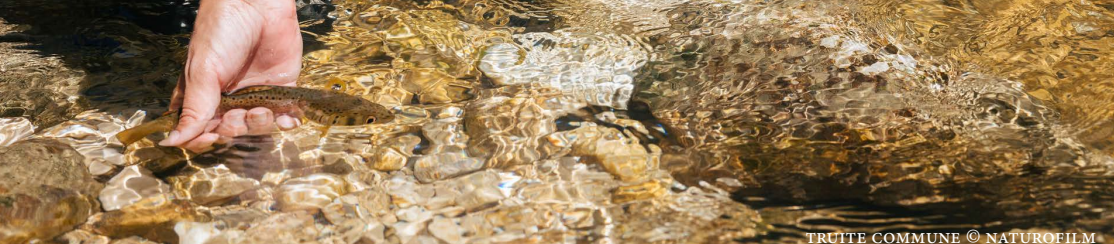
TRUITE COMMUNE