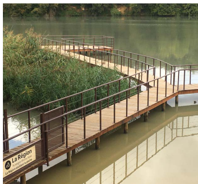
Double ponton de pêche inauguré sur l'Isère (Drôme) - septembre 2023