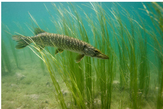
Figure 1 L.MADELON - FNPf

Deux grands aquariums s'invitent sur le salon avec des poissons d'eau douce de la famille des salmonidés et carnassiers à observer. Pour aller plus loin, le public peut aussi s'arrêter autour des microscopes, d'un espace de reproduction d'une frayère naturelle de truite fario avec éclosion des alevins en direct et points d'information pédagogique pour mieux comprendre le fonctionnement des rivières et plans d'eau, la faune, la flore et les conditions de vie indispensables à chaque espèce.